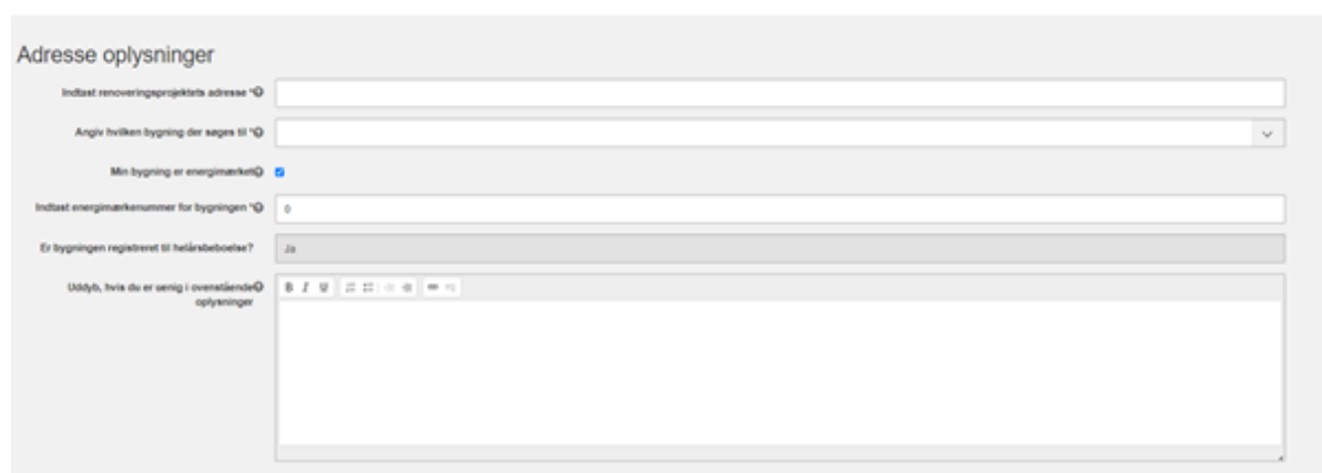
Figur 7 - Valg af energimærke og bygning

Afkrydses "Min bygning er energimærket" ikke og noteres der ikke et energimærkenummer, vil du kunne forvente afslag på din ansøgning.