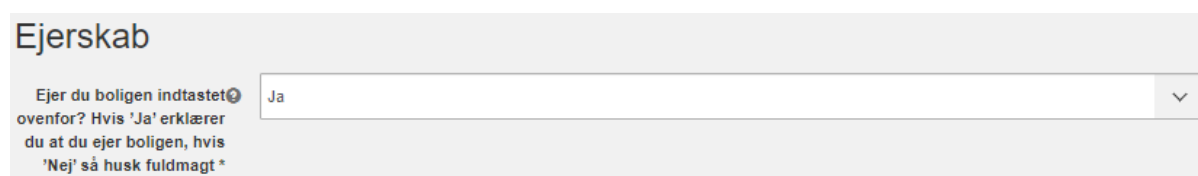
Figur 8 – Ejerskab (a)

Du skal vælge om du bygningsejer, søger med en fuldmagt eller bygningsejer, men ikke er tinglyst.