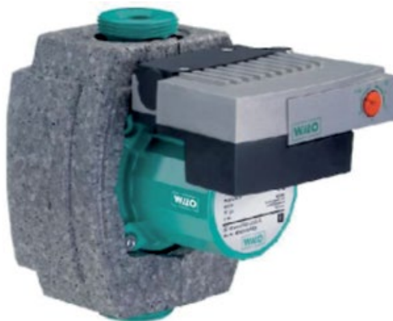
Pumpe med isoleringskappe