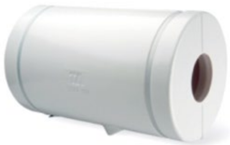
Rørskål afsluttet med plastkappe

Hvis der ikke findes isoleringskapper til de pågældende ventiler og pumper, kan isoleringen udføres med lamelmåtter og pladekapper.