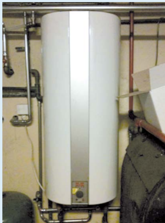
Nyere lodretstående varmtvandsbeholder