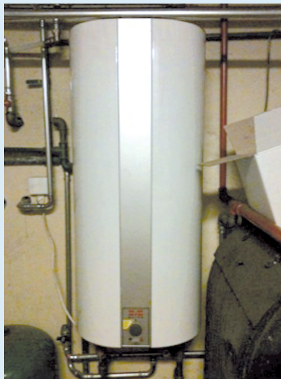
Nyere lodretstående varmtvandsbeholder