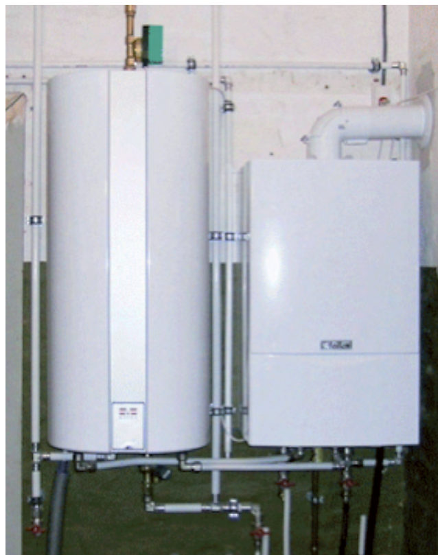
Ny varmtvandsbeholder med ny gaskedel

Når arbejdet er udført, afleveres en brugermanual til kunden. Brugermanualen skal indeholde en beskrivelse af beholderen (inkl. tekniske data), sikkerhedsforskrifter og en betjeningsvejledning.