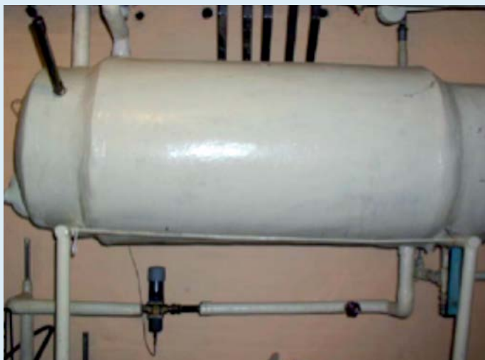
Ældre vandretliggende varmtvandsbeholder

Varmetabene er baseret på en beholdertemperatur på 55 °C og en omgivelsestemperatur på 20 °C. Tabene fra varmtvandsbeholderne er inkl. tilslutninger.