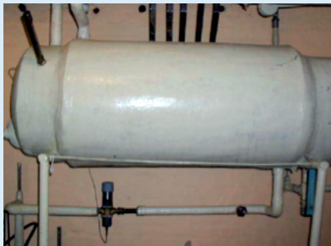
Ældre vandretliggende varmtvandsbeholder

Varmetabene er baseret på en beholdertemperatur på 55 °C og en omgivelsestemperatur på 20 °C. Tabene fra varmtvandsbeholderne er inkl. tilslutninger.