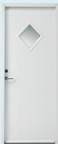
Mindre end 20% rudeandel